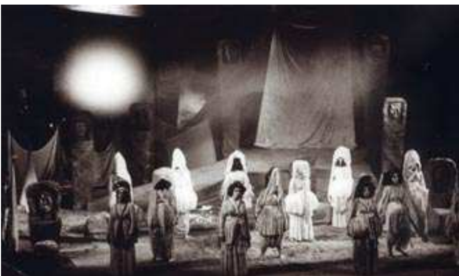
Χορός (Ελένη, Κ.Θ.Β.Ε, 1982, σκην. Α. Βουτσινάς)