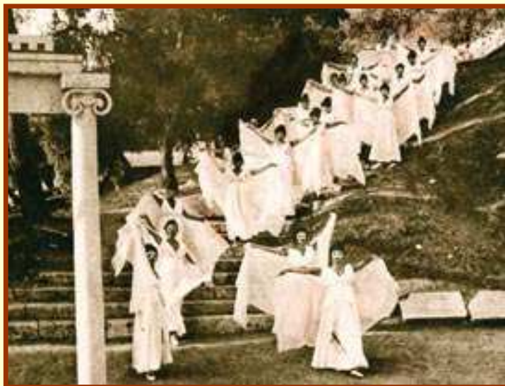
Χορός από παράσταση του Εθνικού Θεάτρου