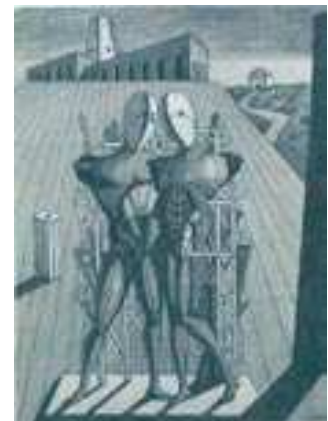
Giorgio de chirico, Διόσκουροι