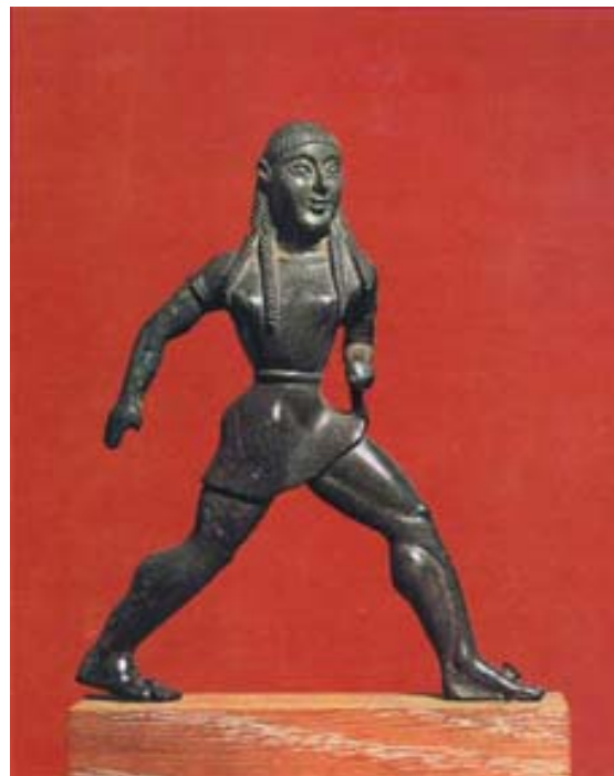
Χάλκινο αγαλματίδιο γυναίκας, Εθνικό Αρχαιολογικό Μουσείο Αθηνών

◆ Ερευνήστε πότε άρχισε, ποιες επιδόσεις και ποιες διακρίσεις έχει ο γυναικείος αθλητισμός. Σχετικά με τις Ελληνίδες αθλήτριες συμβουλευτείτε τη δίτομη ιστορική αναδρομή Ελληνικός Αθλητισμός που εξέδωσε το 1997 το Υφυπουργείο Αθλητισμού.