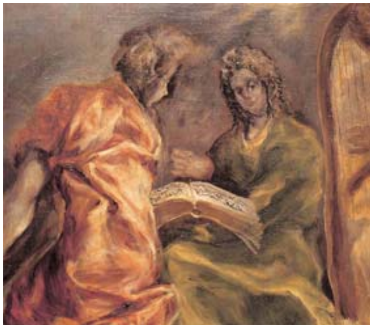
Δομήνικος Θεοτοκόπουλος, Η συναυλία των αγγέλων (λεπτομέρεια)

♦ Απευθυνθείτε στον καθηγητή των θρησκευτικών για να σας υποδείξει έναν Κανόνα. Διαβάστε τον στην τάξη και αναφερθείτε στη μορφή και στο περιεχόμενο αυτού του εκκλησιαστικού κειμένου.