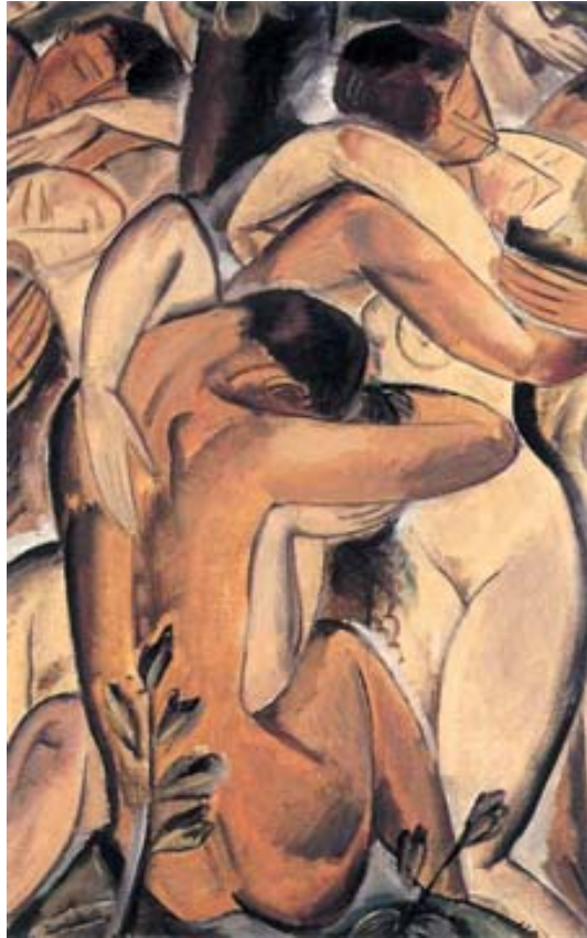
Γιώργος Γουναρόπουλος, Γυμνά ειδύλλια που φιλιούνται

Τα έξι κείμενα που περιλαμβάνονται σ' αυτή την ενότητα περιστρέφονται γύρω από τους δυο σημαντικότε- ρους ίσως συνεκτικούς δεσμούς της κοινωνικής μας ζωής, την αγάπη και τη φιλία. Η έννοια της αγάπης έχει πολλαπλά νοήματα, γι' αυτό