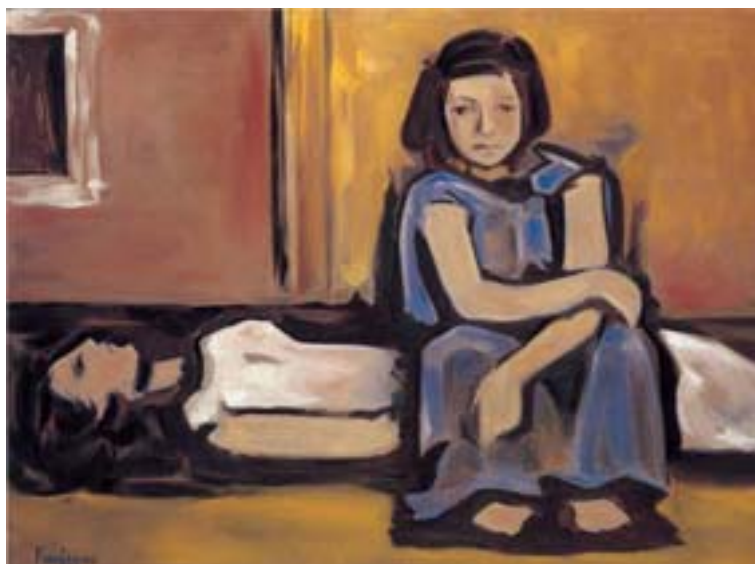
Ορέστης Κανέλλης, Παρουσία