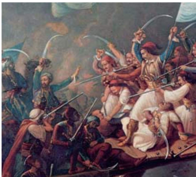
Θεόδωρος Βρυζάκης, Η έξοδος του Μεσολογγίου (λεπτομέρεια)

Τα κείμενα που ανθολογούνται στην ενότητα αυτή παρουσιάζουν, με άξονα την ιστορική συνέχεια του ελληνισμού, διάφορες εκφράσεις και όψεις της νεοελληνικής λογοτεχνικής παράδοσης με θέμα