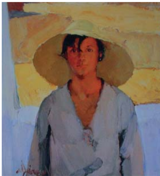
Νικηφόρος Λύτρας, Το ψάθινο καπέλο

Εκείνες οι Κυριακές θα μείνουν μέσα μου ατόφιας, έτσι όπως τις έζησα. Καμιά τους λεπτομέρεια δε θα λησμονηθεί. Πλησιάζαμε τον κόσμο της θάλασσας. Εμείς που ζούσαμε με τα μερμήγκια, τις σαύρες και τα βατράχια, σαστίζαμε μπρος στα κύματα. Αφήναμε τα καβούρια να μπήγουν τις δαγκάνες τους μέσα στη σάρκα μας για ν’