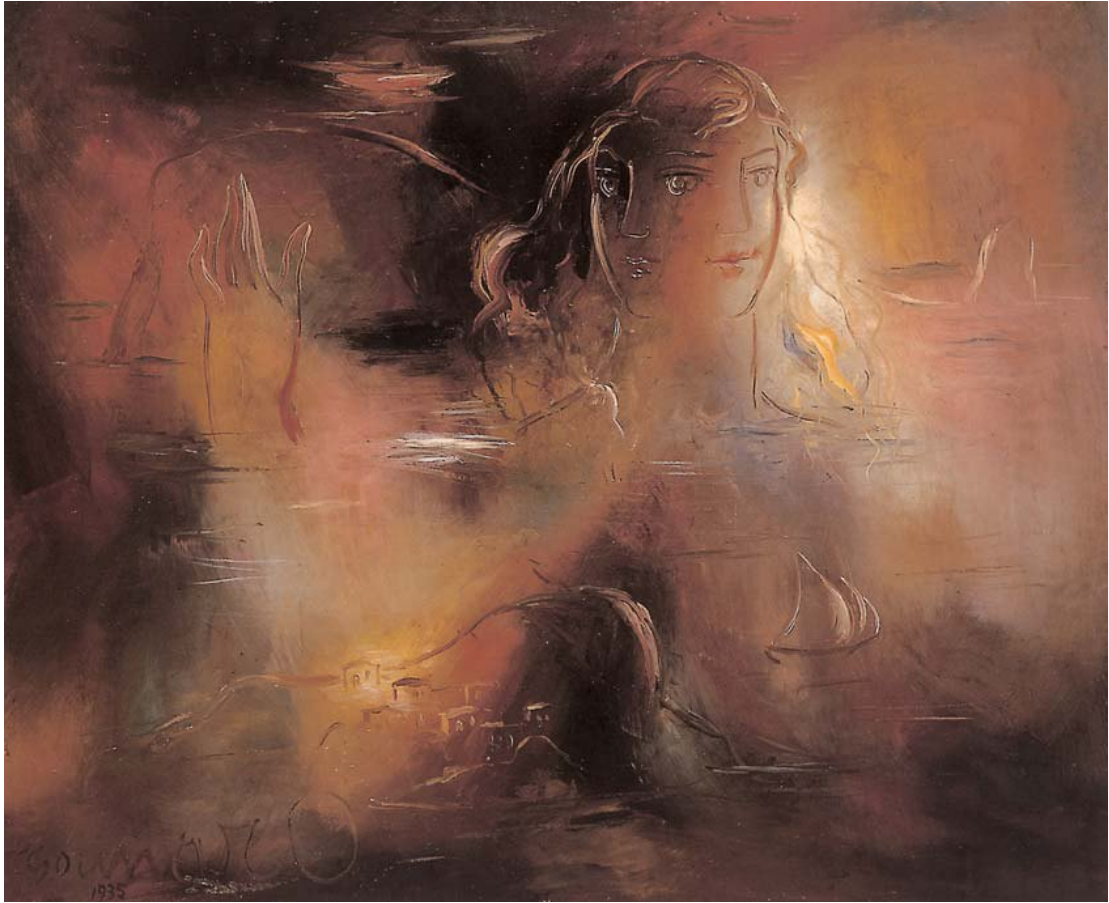
Γιώργος Γουναρόπουλος, Γυναικεία μορφή με δύο πρόσωπα στη θάλασσα