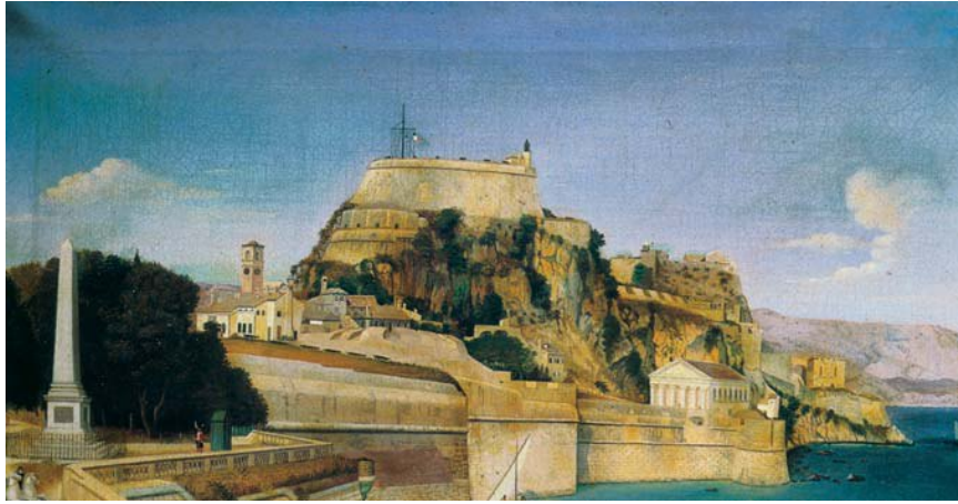
Φραντσέσκο Πίτζε, Η Κέρκυρα με το φρούριο