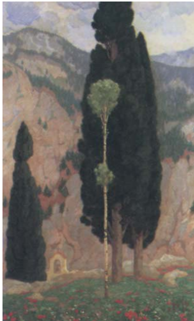
Νικόλαος Οθωναίος, Άνοιξη στην Οίτη

Πώς αντιμετωπίζει τα ίδια φυσικά φαινόμενα ο ποιητής; Συζητήστε τις σχετικές απόψεις του με τον καθηγητή της Φυσικής.