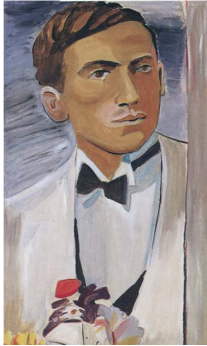
Γιάννης Τσαρούχης, Παραλλαγή πορτρέτου με χάρτινα άνθη