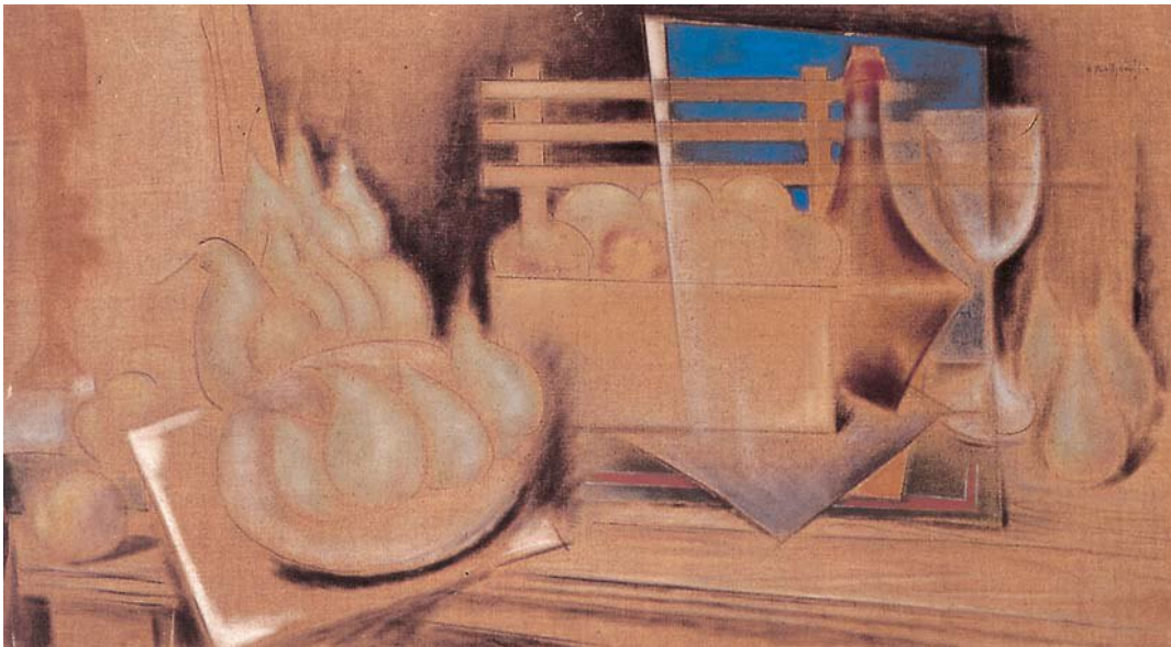
Κωνσταντίνος Παρθένης, Νεκρή φύση