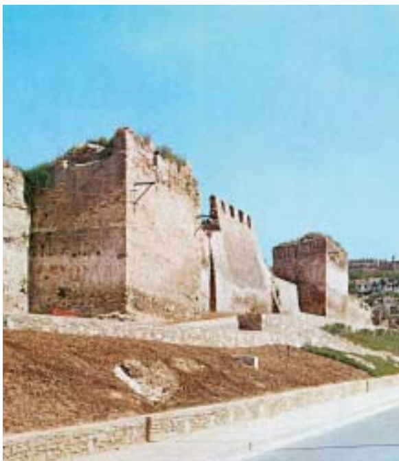
Τα τείχη της Θεσσαλονίκης, όπως είναι σήμερα

«πλήθος αναρίθμητον» και «στεφάνη θανατηφόρος».