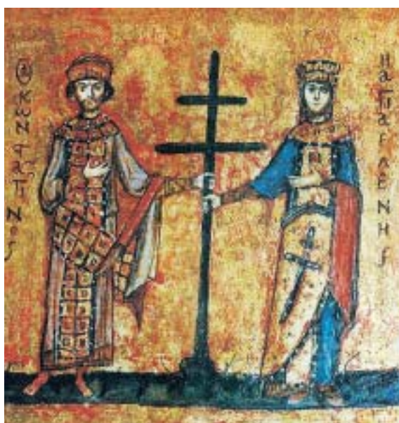
Οι άγιοι Κωνσταντίνος και Ελένη

«Ο Κωνσταντίνος έστειλε τη μητέρα του Ελένη στα Ιεροσόλυμα να αναζητήσει το σταυρό, πάνω στον οποίο σταυρώθηκε ο Χριστός. Κι εκεί, με θαυματουργή βοήθεια που σπάνια σήμερα την αξιώνονται οι αρχαιολόγοι, βρήκε το Γολγοθά. Έβγαλε από τη γη τον ίδιο τον τίμιο σταυρό, τους σταυρούς των (δύο) ληστών, τη λόγχη, τον ακάνθινο στέφανο και όλα τα λείψανα τα σχετικά με τα θεία πάθη. Στο σημείο αυτό έχτισε το ναό της Αναστάσεως του Χριστού που σώζεται έως σήμερα.