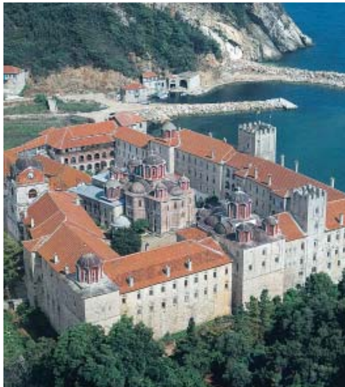
Μονή Εσφιγμένου, Άγιον Όρος