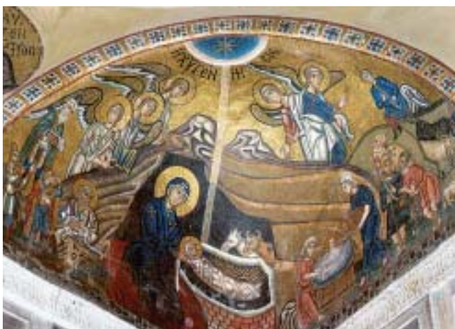
Η εικόνα της Γέννησης, ψηφιδωτό από τη Μονή Δαφνίου

Στα χρόνια των Μακεδόνων χτίστηκαν σε όλη την αυτοκρατορία πολλές και ωραίες εκκλησίες με ένα νέο ρυθμό , που τον ονόμασαν Βυζαντινό . Το κτίσμα τους έχει σχήμα σταυρού και στο μέσον του στηρίζεται ο τρούλος. Οι αγιογραφίες και τα ψηφιδωτά τους έχουν τη φυσικότητα, τη χάρη και την αισιοδοξία της αρχαίας ελληνικής τέχνης.