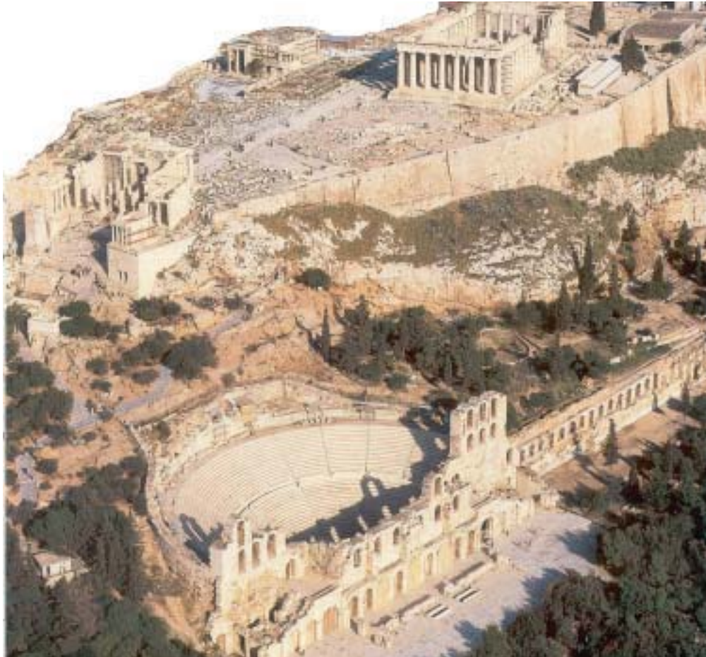
Το ρωμαϊκό Ωδείο Ηρώδη του Αττικού, κάτω από την Ακρόπολη