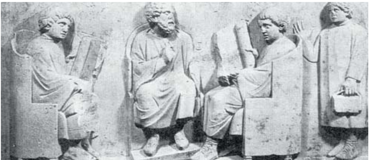
Δάσκαλος και μαθητές σε ώρα μαθήματος ( Ανάγλυφο, Trier, Μουσείο Ρήνου )

Τα Ρωμαίοπουλα μάθαιναν γράμματα από δασκάλους δούλους των οικογενειών τους ή από ελεύθερους που είχαν δικά τους σχολεία. Διδάσκονταν ανάγνωση, γραφή, γραμματική, αριθμητική, ιστορία και υπακοή. Οι μαθητές υπάκουαν στις συμβουλές ή τις εντολές των δασκάλων τους τόσο, ώστε «οι λέξεις μαθητής και πειθαρχία ήταν σχεδόν συνώνυμες».